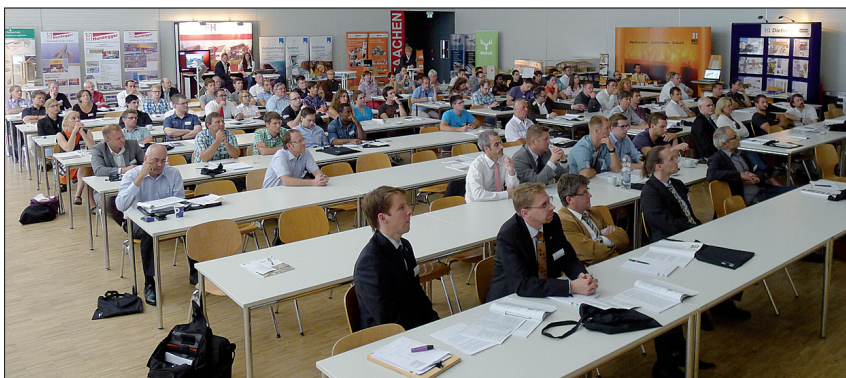
Rund 145 Teilnehmer konnte die Aachener Holzbautagung verbuchen. Eine Fachausstellung umrahmte die Veranstaltung.

Forst- und Holzwirtschaft, Holzverwendung im Bauwesen, Architektur und Holzbau-Ingenieurwesen – ein gewagter Spagat, wenn man davon ausgeht, dass nicht jeden alles interessiert.