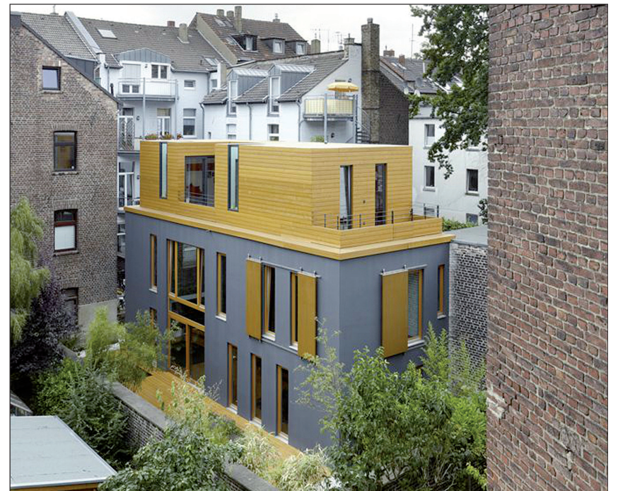
Das 15 m lange und 5 m breite Einfamilienhaus liegt im Hinterhof eines viergeschossigen Altbaus. Der graue Kubus wurde erst später mit einem Staffelgeschoss in Holzbauweise aufgestockt.